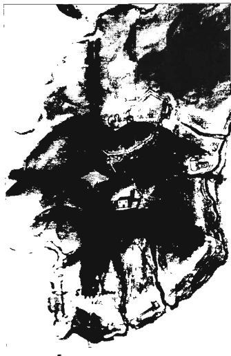
El monte Hacho en el grabado de Ceuta de finales del siglo XVI del Archivo General de Simanca (M. P. y D., Guerra Antigua , leg. 1.518)

anteriormente–, enlazando al Este con la fortificación de la cúspide del monte. De esta forma, también la atalaya Almenara (actual San Antonio), quedaba dentro de la fortificación. Por tanto, solo la mitad Sur del monte quedaba sin estar dentro de las murallas, siendo éstas en gran parte innecesarias por lo inhóspito y abrupto de la costa. Sin embargo, es muy posible que existieran muros y torres de defensa en las calas, alguna de las cuales, como la del Desnargado, debe su nombre –ya en época portuguesa– al desembarco del célebre pirata. Al menos una de estas torres se situaba junto al santuario de Sidi Bel Abbés al Sabtī 40 y fué reutilizada y reformada en época portuguesa 41 .