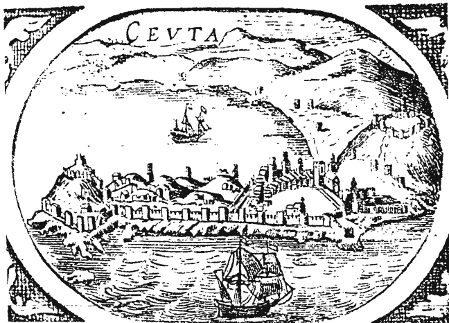
Ceuta en el siglo XVI, según el grabado de Civitates Orbis Terrarum de Georgius Braun

Las continuas reformas en la fortificación del monte ha hecho que la fortificación actual tenga muy poco de medieval, salvo parte de su estructura general, cimientos y restos de un par de torres medievales, muy reformadas, cuyas fotos ha publicado recientemente Pavón Maldona-